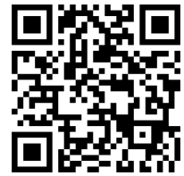
新生線上報到系統