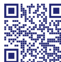
報名 QR 碼